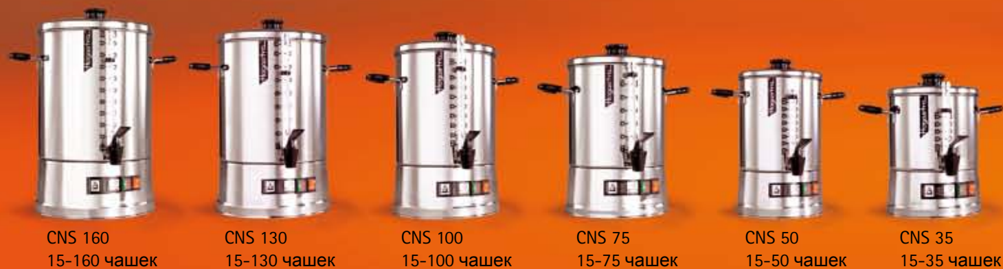
CNS 160 15-160 чашек CNS 130 15-130 чашек CNS 100 15-100 чашек CNS 75 15-75 чашек CNS 50 15-50 чашек CNS 35 15-35 чашек

Автоматические кофеварки Hogastra избавят вас от постоянной необходимости возиться с банками кофе, — Вы всегда будете иметь готовый ароматный кофе.